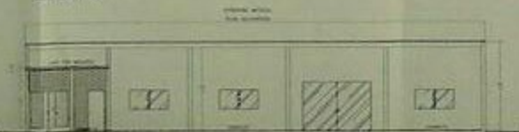
CORTE A A ESCALA 1:100