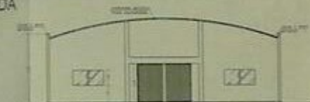
CORTE C C ESCALA 1:100