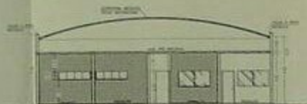
CORTE B B ESCALA 1:100